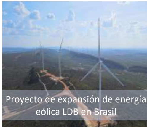
Proyecto de expansión de energía eólica LDB en Brasil