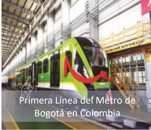
Primera Línea del Metro de Bogotá en Colombia