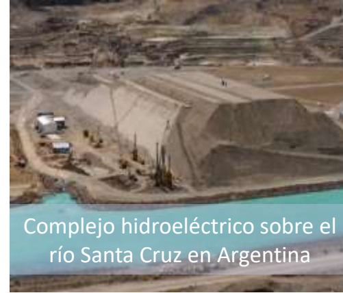
Complejo hidroeléctrico sobre el río Santa Cruz en Argentina