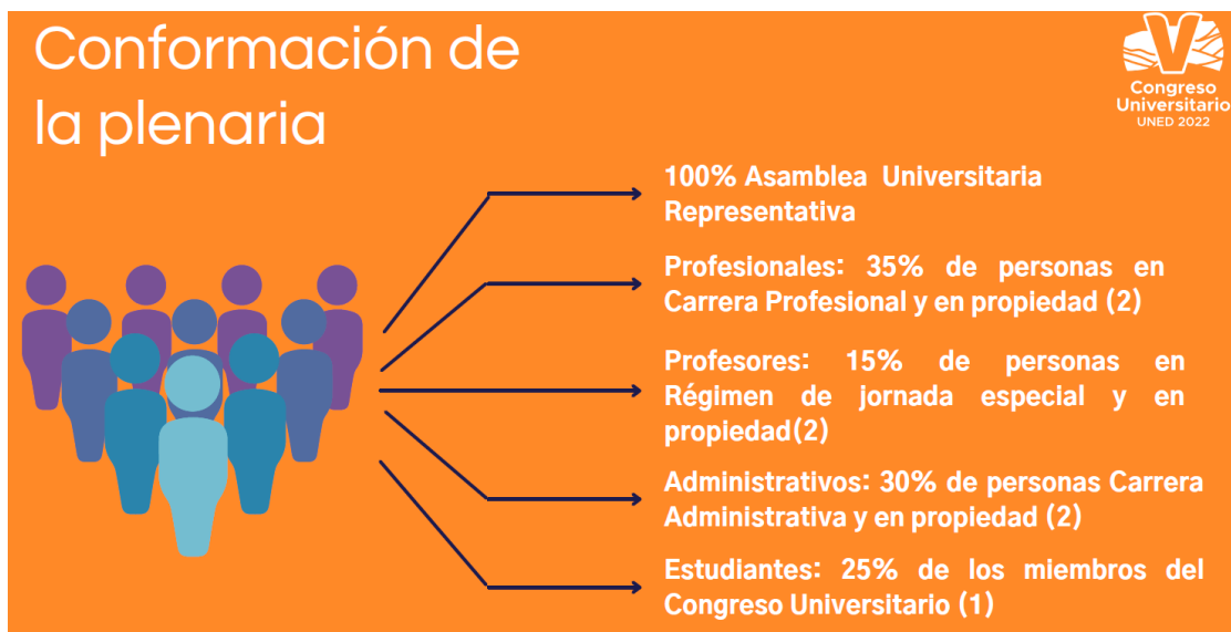
Figura 1. Conformación de la plenaria de Congreso Universitario según el artículo 10 del Estatuto Orgánico

(1) Le corresponde a la Federación de Estudiantes de la Universidad Estatal a Distancia, reglamentar la participación de estos representantes.