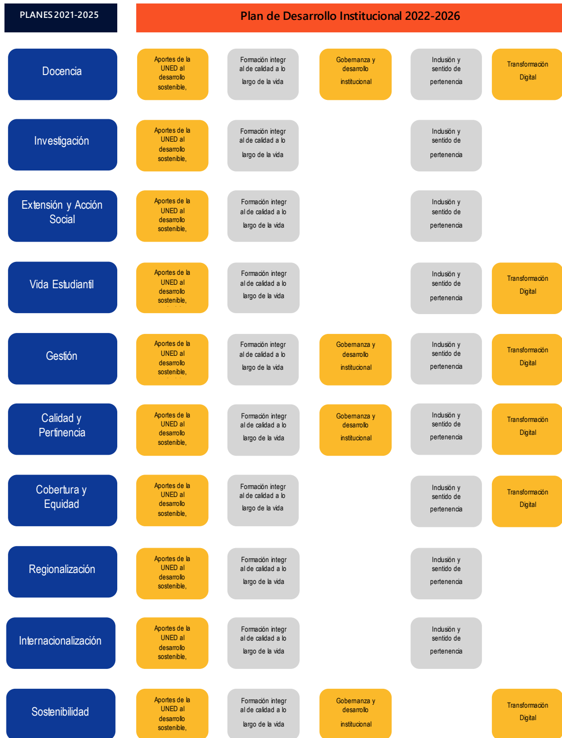
Figura 4. Vinculación del PLANES 2021-2025 con el Plan de Desarrollo Institucional 2022-2026

Fuente: elaborado por el Centro de Planificación y Programación Institucional, junio, 2022.