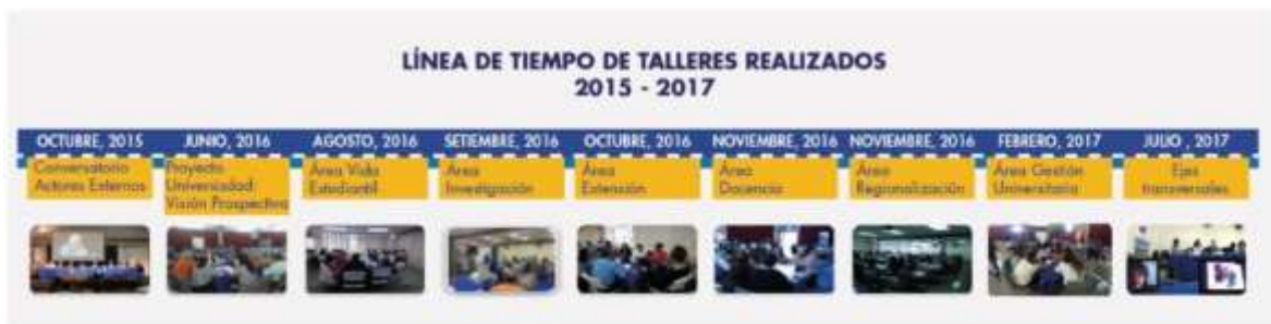
Figura 3. Línea de tiempo de las actividades regionales realizadas en el año 2017 para la construcción del Análisis de Contexto de la UNED