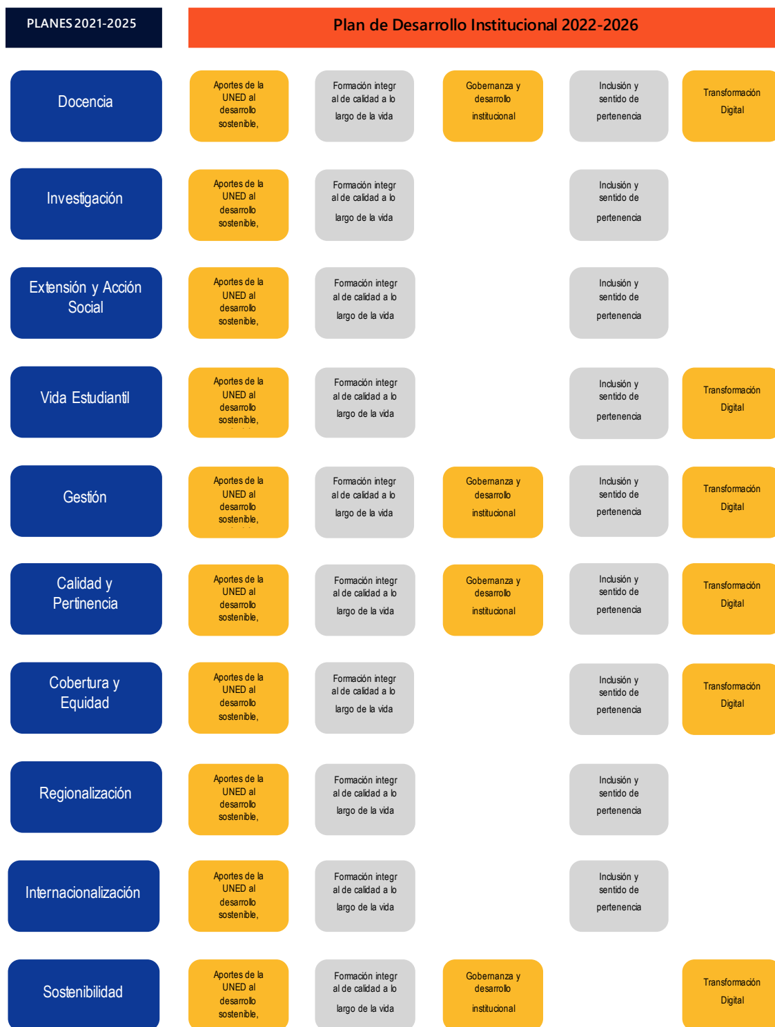
Figura 4. Vinculación del PLANES 2021-2025 con el Plan de Desarrollo Institucional 2022-2026

Fuente: elaborado por el Centro de Planificación y Programación Institucional, junio, 2022.