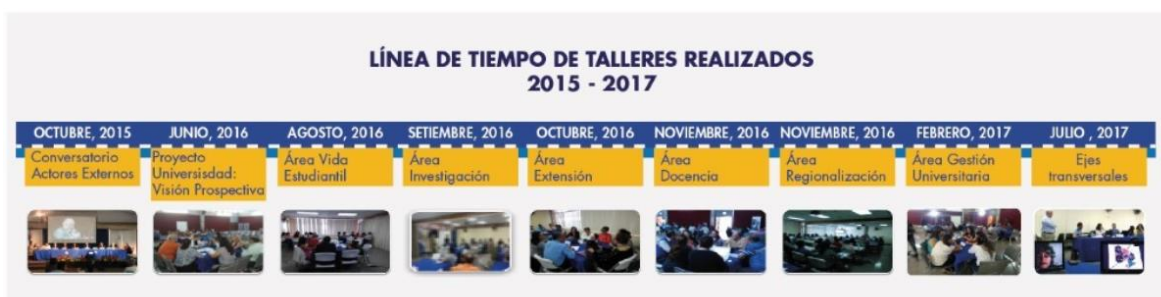
Figura 2. Línea de tiempo de las actividades internas realizadas en el período 2015-2017 para la construcción del Análisis Situacional de la UNED

Las siguientes figuras representan una línea de tiempo que muestra las fechas y temas de los talleres realizados durante el 2015-2017.