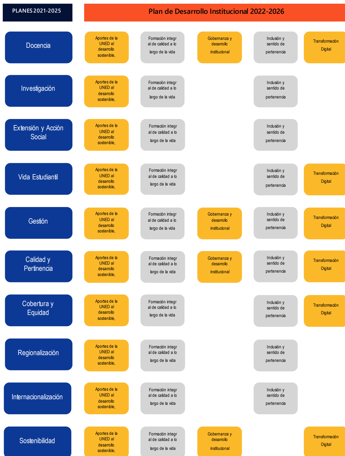
Figura 4. Vinculación del PLANES 2021-2025 con el Plan de Desarrollo Institucional 2022-2026

Fuente: elaborado por el Centro de Planificación y Programación Institucional, junio, 2022.