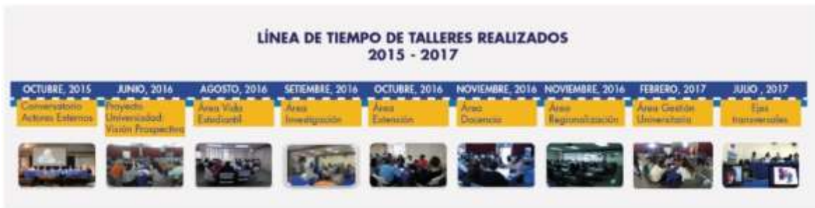
Figura 3. Línea de tiempo de las actividades regionales realizadas en el año 2017 para la construcción del Análisis de Contexto de la UNED