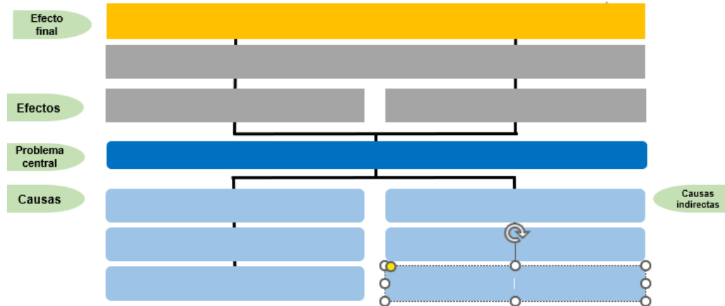
Figura 1 Árbol de problemas